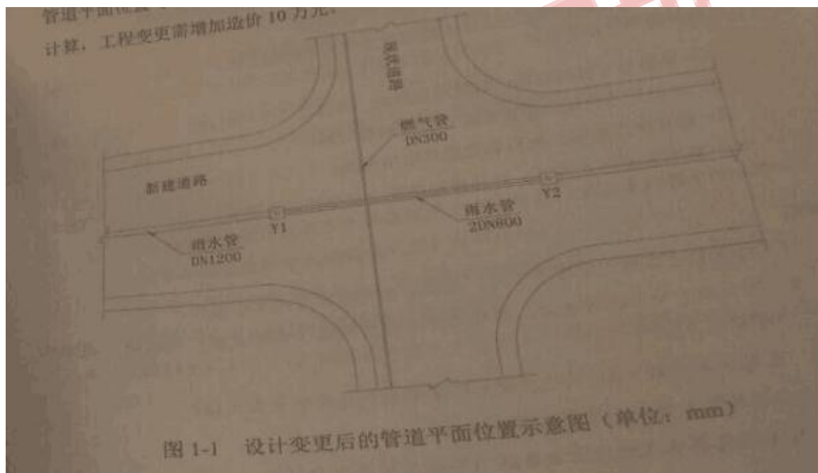
图 1-1 设计变更后的管道平面位置示意图(单位：mm)