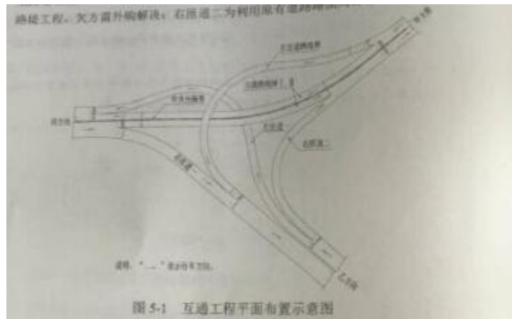
图 5-2 主线跨线桥 I 第 2 联箱梁预应力张拉端钢绞线束横断面布置示意图

主线跨线桥 I 的第 2 联为(30m+48m+30m)预应力混凝土连续箱梁，其预应力张拉端钢绞线束横断面布置如图 5-2 所示。预应力钢绞线采用直径 \Phi 15.2\text{mm} 高强低松弛钢绞线。每根钢绞线由 7 根钢丝捻制而成。代号 S22 的钢绞线束由 15 根钢绞线组成，其在箱梁内的管道长度为 108.2m。